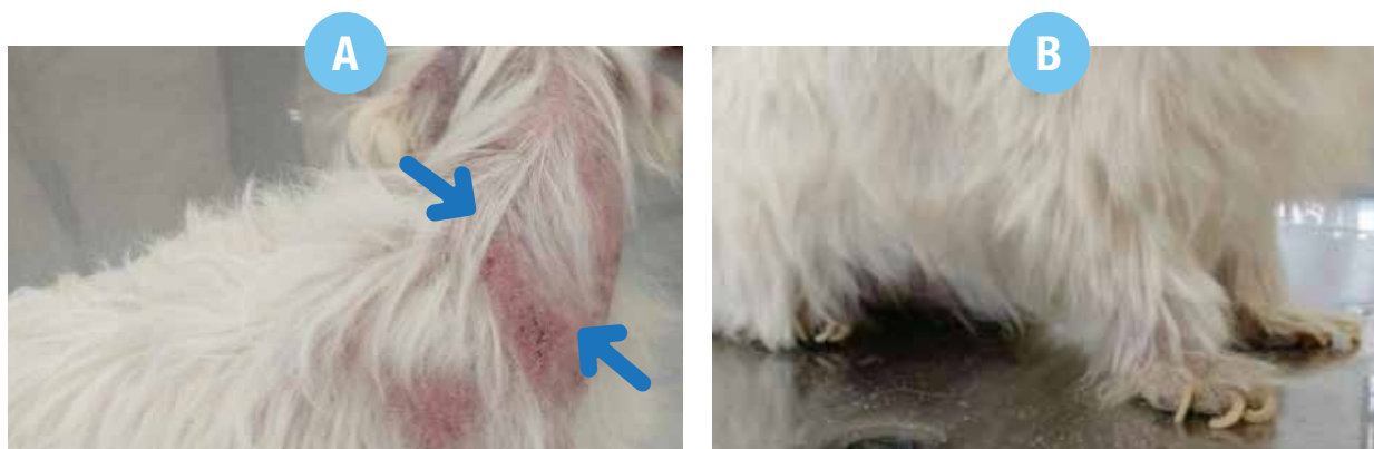
Figura 1 - Cão com diagnóstico de leishmaniose visceral apresentando: A - Área de hipotricose em região cérvico-torácica, com presença de eritema, disqueratinização farinácea, e crostas hemáticas (setas); B - Unhas compridas (onicogribose), hipotricose em patas anteriores, além de escamas farináceas visíveis na mesa de consulta oriunda da descamação generalizada apresentada pelo animal.

Relativamente ao aspecto clínico, a LVC pode se manifestar com um amplo espectro de apresentações e em diferentes graus de gravidade, não havendo sinais considerados específicos ou patognomônicos da enfermidade. Dessa forma, podem ocorrer alterações clínicas relacionadas à qualquer órgão ou sistema, como o cardiorrespiratório, circulatório, digestório, genitourinário, locomotor, oftálmico, nervoso e, particularmente, o tegumentar, sendo as manifestações clínicas mais comumente observadas no cão doente: disqueratinização, alopecia (Figura 1A), dermatite erodo-ulcerativa e/ou pápulo-nódulo-pustular, hiperqueratose nasodigital, onicogribose (Figura 1B), dentre outras alterações cutâneas; linfadenomegalia, hepatoesplenomegalia; emagrecimento progressivo, inapetência ou polifagia, vômito, diarreia; mucosas pálidas, letargia; poliúria, polidipsia, êmese; blefarite, ceratoconjuntivite, uveíte, endoftalmite; vasculite, quadros hemorrágicos, epistaxe, distúrbios de coagulação; artrite/poliartrite, osteomielite, polimiosite, atrofia muscular; e menos comuns, incluem-se manifestações neurológicas variadas, dentre outras.